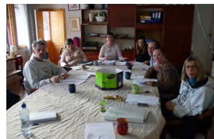
RÅDGIVNINGSGRUPPEN FOR UTVIKLINGSHEMMEDE I BÆRUM KOMMUNE

steg for steg: Bufdirs nettside vernmotovergrep.no, som har retningslinjer og veileder og kurset «Ingen hemmeligheter» på Helsekompetanse.no sine sider. Seksuelle overgrep er like skadelig for personer med utviklingshemming som for alle andre. Dessuten er de ekstra utsatt og trenger nærpersoner som våger å tro på at det skjer.