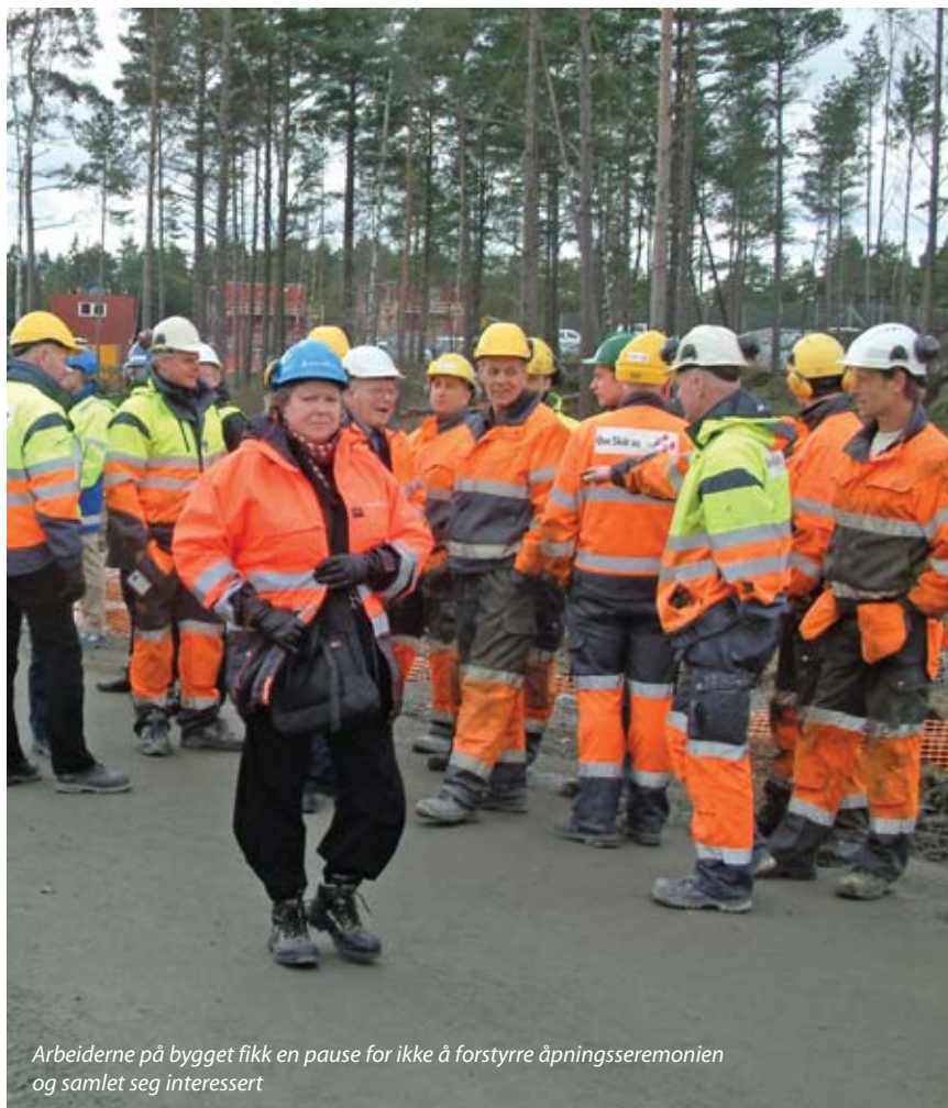
Arbeiderne på bygget fikk en pause for ikke å forstyrre åpningsseremonien og samlet seg interessert

i straffen. Halden fengsel blir topp moderne med fleksible tilbud som skal gi innsatte bedre mulighet til å velge en fremtid uten kriminalitet, sa justisminister Knut Storberget. – Jeg er spesielt glad for at vi får servicetorg innenfor murene. Her vil innsatte kunne kobles sammen med rett offentlig instans og frivillige organisasjoner i god tid før løslatelse, sa statsråden videre.