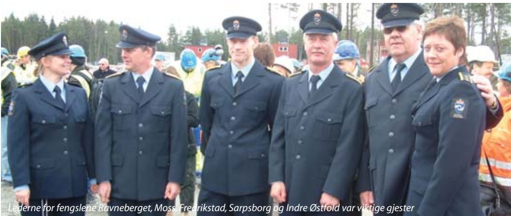
Lederne for fengslene Ravneberget, Moss, Fredrikstad, Sarpsborg og Indre Østfold var viktige gjester