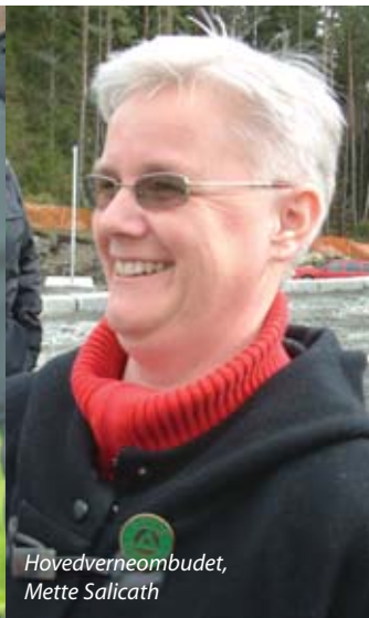
Hovedverneombudet, Mette Salicath